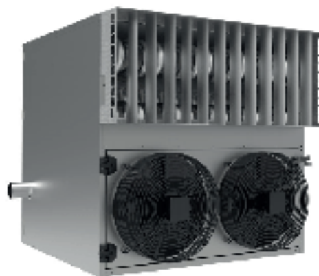
model AGRO 55, 85